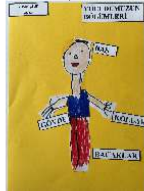
YUSUF ÇELİK ANA/1