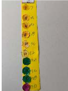
NAZAN AK ANA/4