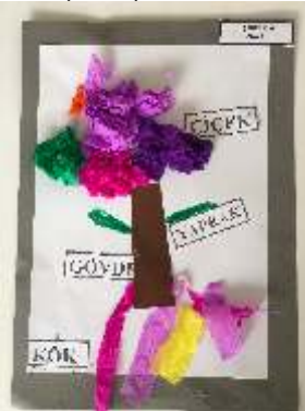
ŞAHİN ŞAKI ANA/4