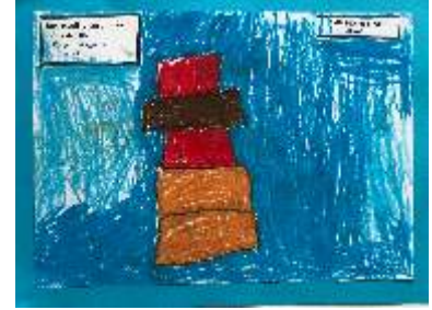
AKIN TEO KIZILTAŞ ANA/1