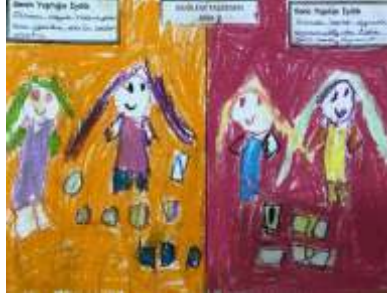
BÜĞLEM TAŞKESEN ANA/7